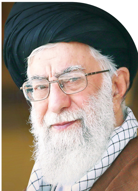
حضرت آیت‌الله خامنه‌ای رهبر معظم انقلاب اسلامی:

مسئولین کشور، دولتمردان کشور که خب بحمدالله مشغول کار و فعالیتند، به این نکته توجه کنند که بسیاری از کارهای مثبت آنها میتواند دل جوان‌ها را پُر از امید کند، لبریز از امید بکند و اینها را امیدوار بکند. وقتی که جوان امید داشت، در میدان‌های مختلف خوب کار می‌کند، خوب تلاش می‌کند، خوب درس می‌خواند، خوب تحقیق می‌کند. یکی این است که نگذارید بعضی با وسوسه‌های خود در فضای مجازی و غیر فضای مجازی در جهت مخالف امیدوار کردن جوان‌ها حرکت بکنند.